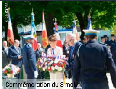
Commemoration du 8 mai

Mardi 21 mai / CSC La Plaine / infos : 01 49 69 60 10