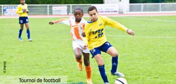
Tournoi de football