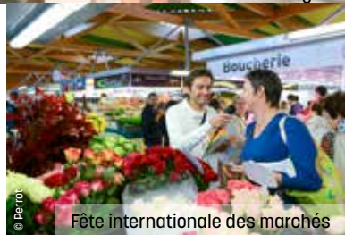
Fête internationale des marchés