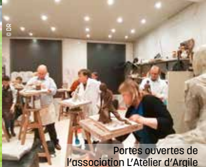
Portes ouvertes de l'association L'Atelier d'Argile

Grande tombola, avec de nombreuses box du marché à gagner contenant chacune une fiche recette et des produits issus du marché. Événement parrainé