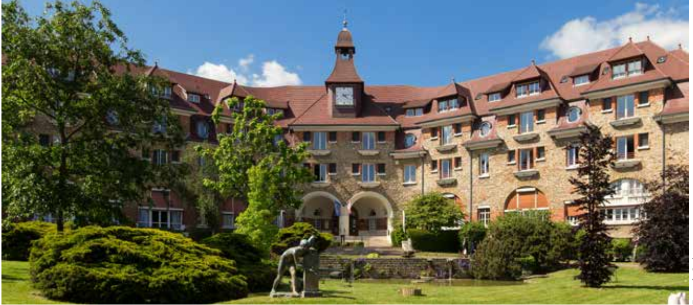
Foyer de Cachan