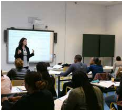
Foyer de Cachan

Créé en 1915, le Foyer de Cachan accueille des jeunes en difficulté au sein de filières professionnelles. L'établissement, qui fait le pari de l'accompagnement et de la motivation des élèves, affiche un taux de réussite au bac de 92%.