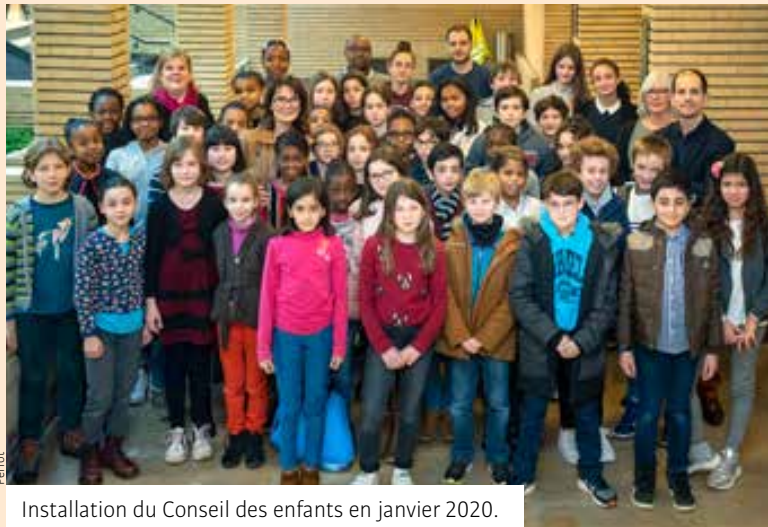
Installation du Conseil des enfants en janvier 2020.

Le Conseil des enfants a été créé en 1994 afin de permettre à des enfants cachanais de 9 à 13 ans de participer à la vie locale et ainsi développer leur apprentissage de la citoyenneté. Comme leurs aînés, les enfants « font campagne » au sein de leurs établissements afin de présenter leurs idées et permettre à leurs camarades d'élire celle ou celui qui les aura le plus convaincus. Une fois élus, les membres du Conseil des enfants siègent au sein de différentes commissions (sports, culture et loisirs / solidarité et citoyenneté / environnement et développement durable). Le Conseil participe aux événements de la Ville et organise des projets solidaires, environnementaux, sportifs ou culturels. Une fois par trimestre,