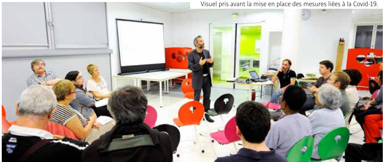
Visuel pris avant la mise en place des mesures liées à la Covid-19.

La Mission locale Innovam guide les jeunes dans l'élaboration de leur parcours individualisé. Accueil sur rendez-vous. 1 rue de la Gare. Infos au 01 41 98 65 00