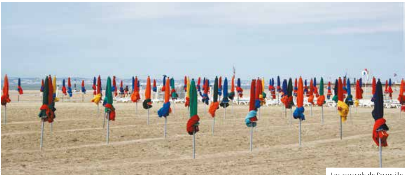
Les parasols de Deauville.