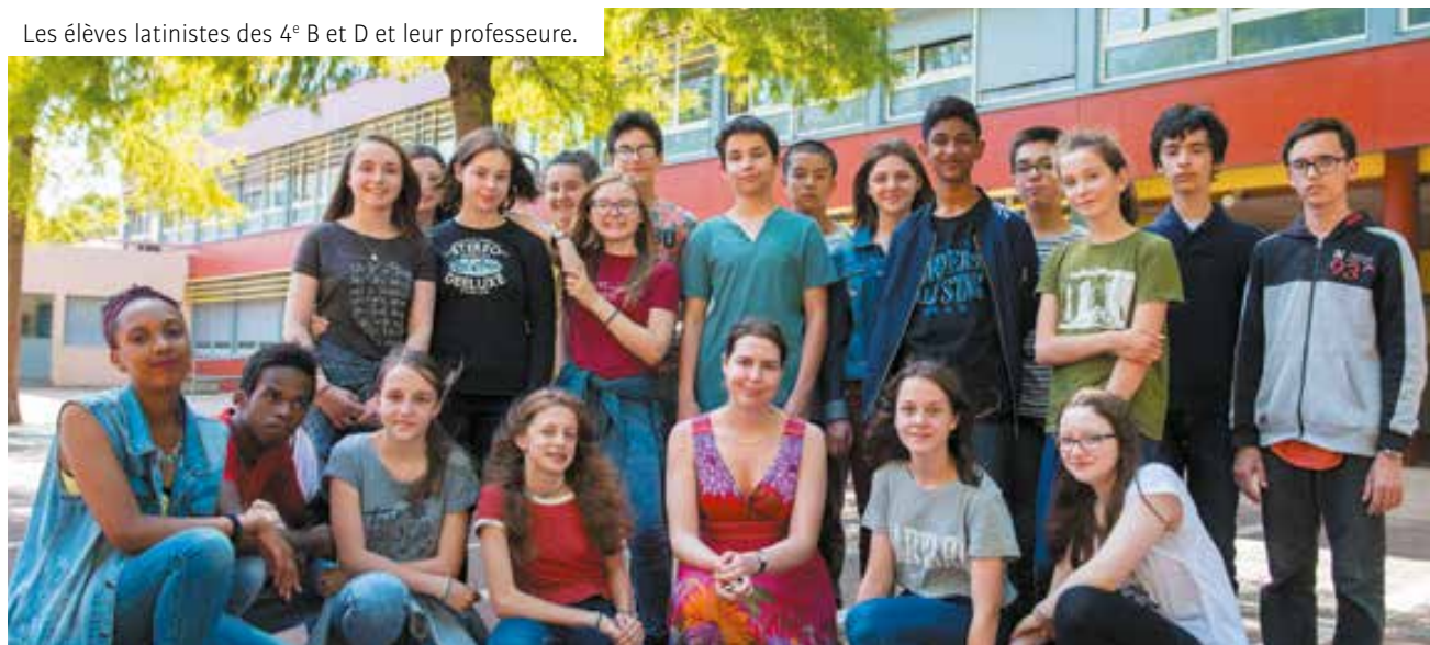
Les élèves latinistes des 4 e B et D et leur professeure.

« Ce concours, c'était un mélange entre une préparation à un examen et un jeu. Je savais qu'il n'y avait pas d'enjeu trop important donc je n'étais pas stressée mais j'ai quand même beaucoup travaillé pour le groupe et pour le concours individuel. Il y a eu beaucoup de solidarité entre les élèves pour la préparation. »