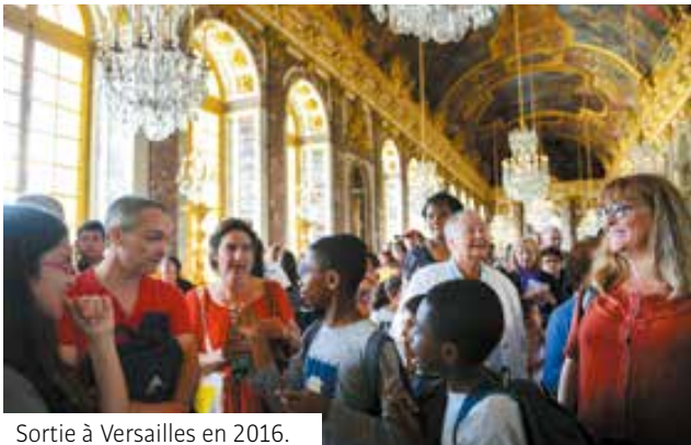
Sortie à Versailles en 2016.

Les CSC eux aussi vous proposent des excursions estivales de qualité. Allez admirer le long cou des girafes du