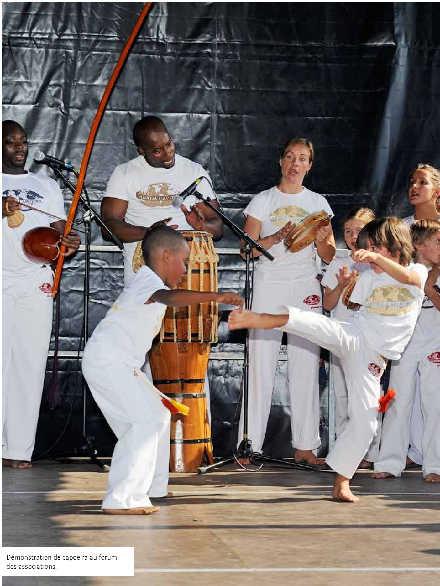
Démonstration de capoeira au forum des associations.