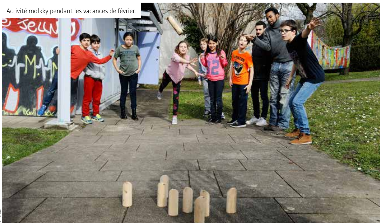
Activité molkky pendant les vacances de février.

« Autonomie, liberté et convivialité à l'espace jeunes »