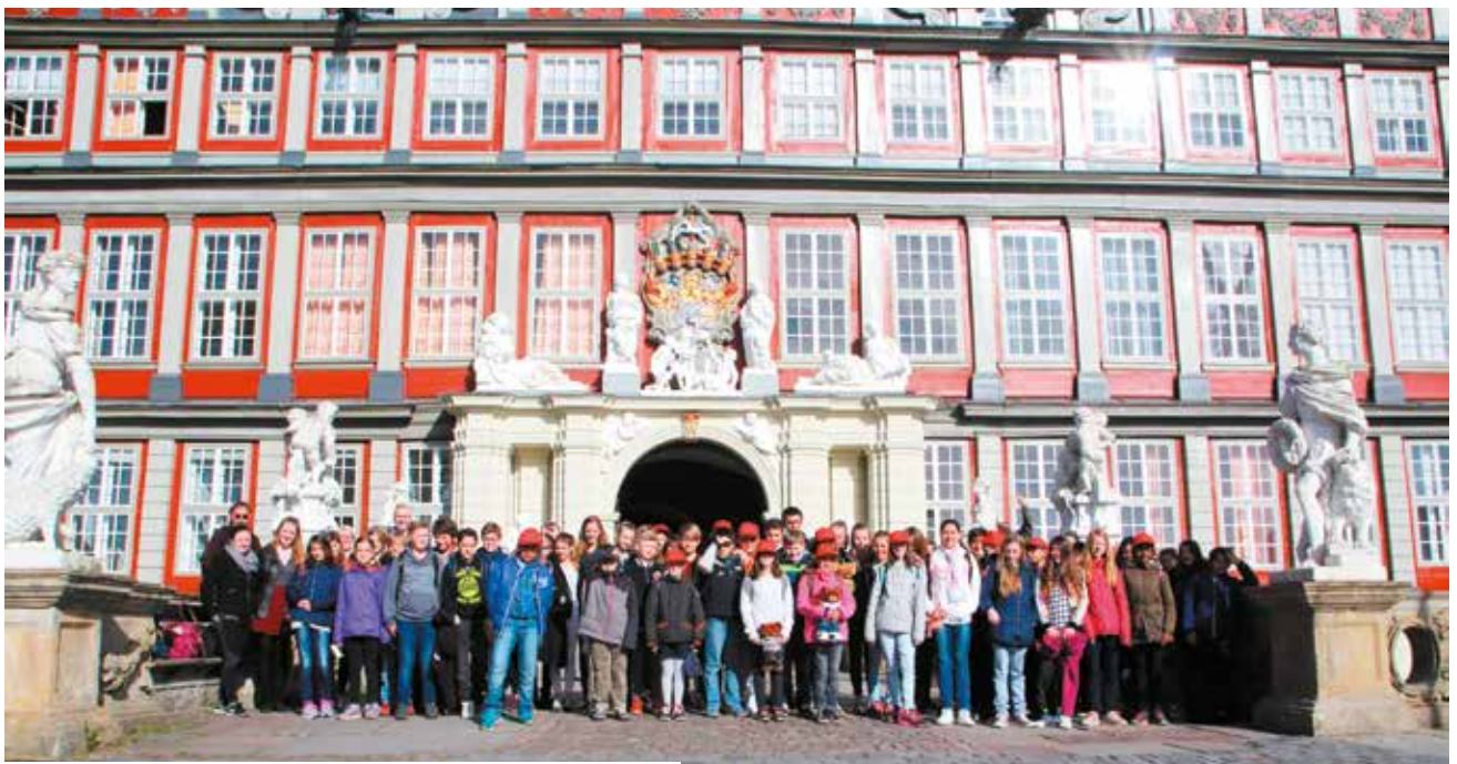
Les jeunes cachanais posant devant le château de Wolfenbüttel