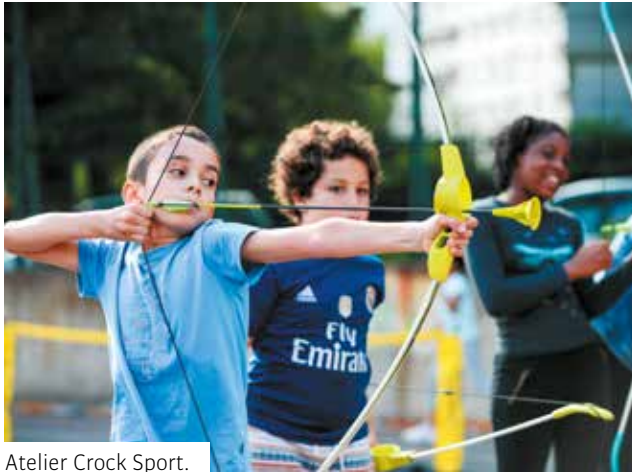
Atelier Crok Sport.

Les activités se déroulent au complexe sportif Léo Lagrange, dans les city stades La Plaine, Courbet et Cité jardins et à la salle de tennis de table. Elles sont gratuites. Pour y participer, il faut se munir de la carte Crok'sport délivrée gratuitement au complexe Léo Lagrange. Pour l'obtenir, il faut vous munir d'une photo, d'un justificatif de domicile, d'une pièce d'identité et d'une autorisation parentale pour les mineurs.