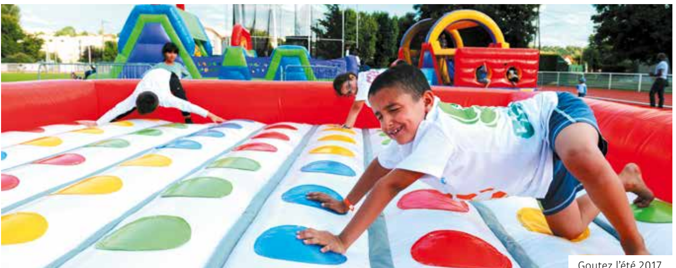
Goutez l'été 2017.

En parallèle, les activités Crok'sport vous attendent à l'intérieur du complexe.