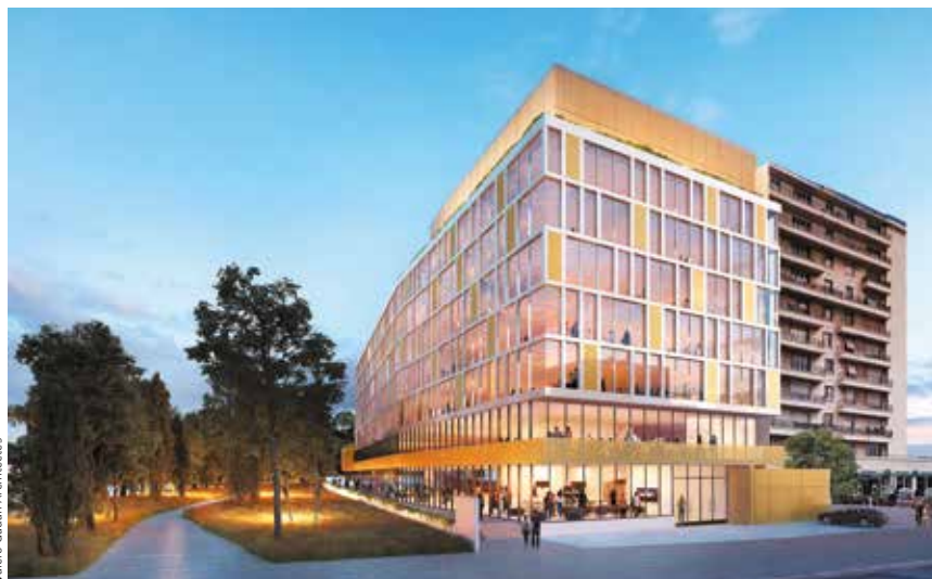
Valero Gadan Architectes

Arobase, tel sera le nom de cet immeuble de bureaux qui pourra accueillir plusieurs entreprises du secteur tertiaire, sur des surfaces allant de 300 m 2 à 1 400 m 2 par étage, au pied du RER Bagneux-Pont royal.