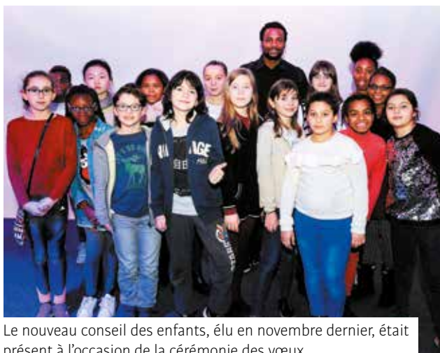
Le nouveau conseil des enfants, élu en novembre dernier, était présent à l'occasion de la cérémonie des vœux.

2018 sera également marquée par la commémoration du centenaire de la 1 ère Guerre Mondiale. Nous espérons que nos amis du Landkreis de Wolfenbüttel seront avec nous pour cette célébration qui affirmera aussi notre attachement à l'Europe unie et solidaire. »