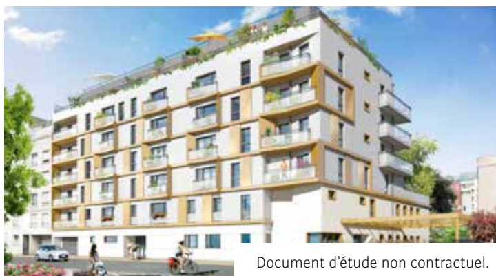
Document d'étude non contractuel.

Dans le cadre des opérations urbaines de la ZAC Desmoulins, la commune a décidé de confier à la société SOGEPROM la construction d'un programme de 38 logements en accession, incluant des locaux d'activités rue des Deux frères. Ces nouveaux logements répondent aux objectifs fixés par le PLU.