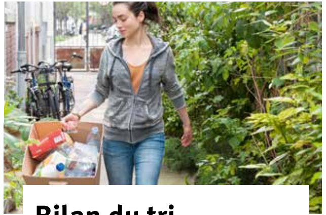
eco-emballages / Pierre Antoine