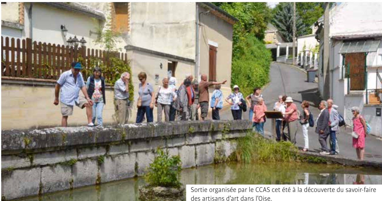
Sortie organisée par le CCAS cet été à la découverte du savoir-faire des artisans d'art dans l'Oise.

Contacts à retrouver sur : www.ville-cachan.fr et dans le guide des loisirs