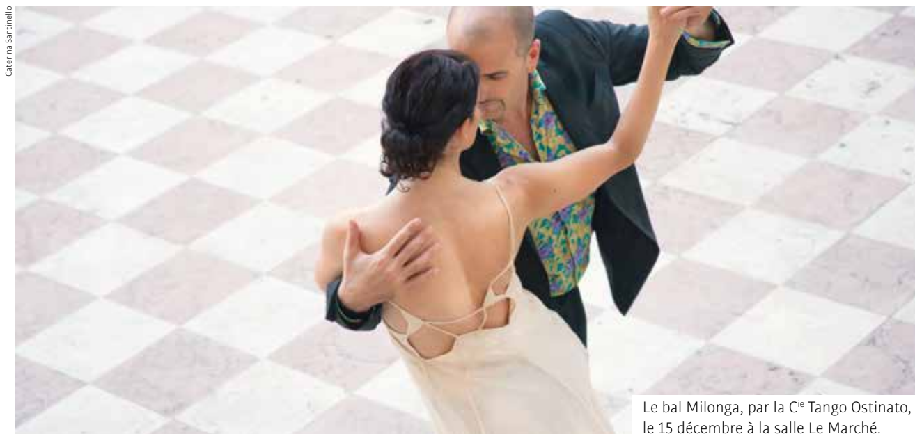
Le bal Milonga, par la C ie Tango Ostinato, le 15 décembre à la salle Le Marché.

Après 3 années hors les murs, l'équipe du Théâtre Jacques Carat vous propose une nouvelle saison hors du commun avec, en point d'orgue, l'ouverture du nouveau théâtre au printemps. À année exceptionnelle, organisation et programmation exceptionnelles !