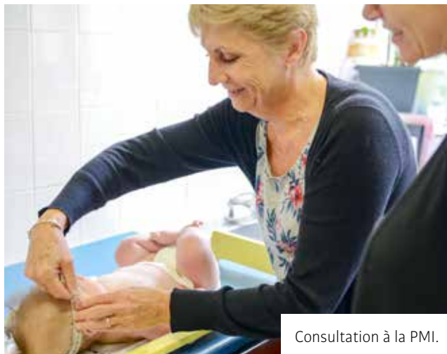
Consultation à la PMI.

La prévention et l'éducation sont des enjeux majeurs de santé publique. Ainsi, la Ville multiplie les actions qui visent à encourager les bons comportements.