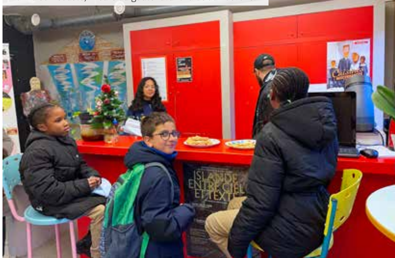
À la maison Cousté, l'heure du goûter avant l'aide aux devoirs.

« Afin d'élargir la liste des bénéficiaires des aides alimentaires, le règlement intérieur de la commission d'aides facultatives a été révisé. Depuis juillet 2021, il faut être Cachanais depuis trois mois (au lieu de six auparavant) pour accéder à l'épicerie solidaire. De surcroît, la municipalité a souhaité instaurer une aide coup de pouce à l'énergie d'une valeur de 30 euros, votée le 7 décembre 2022 lors du conseil d'administration du CCAS. Ces aides s'ajoutent à celles déjà existantes. Toute personne peut se rendre au CCAS pour que sa situation soit étudiée et connaître ses droits. »