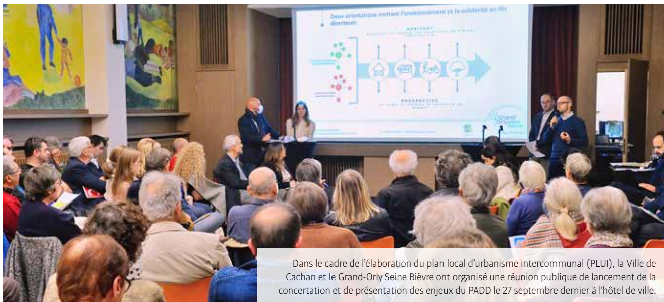
Dans le cadre de l'élaboration du plan local d'urbanisme intercommunal (PLUI), la Ville de Cachan et le Grand-Orly Seine Bièvre ont organisé une réunion publique de lancement de la concertation et de présentation des enjeux du PADD le 27 septembre dernier à l'hôtel de ville.

> Sur le site parlonsensemble-cachan.fr ou à la Maison des services publics, direction du Développement urbain, 3 rue Camille-Desmoulins.