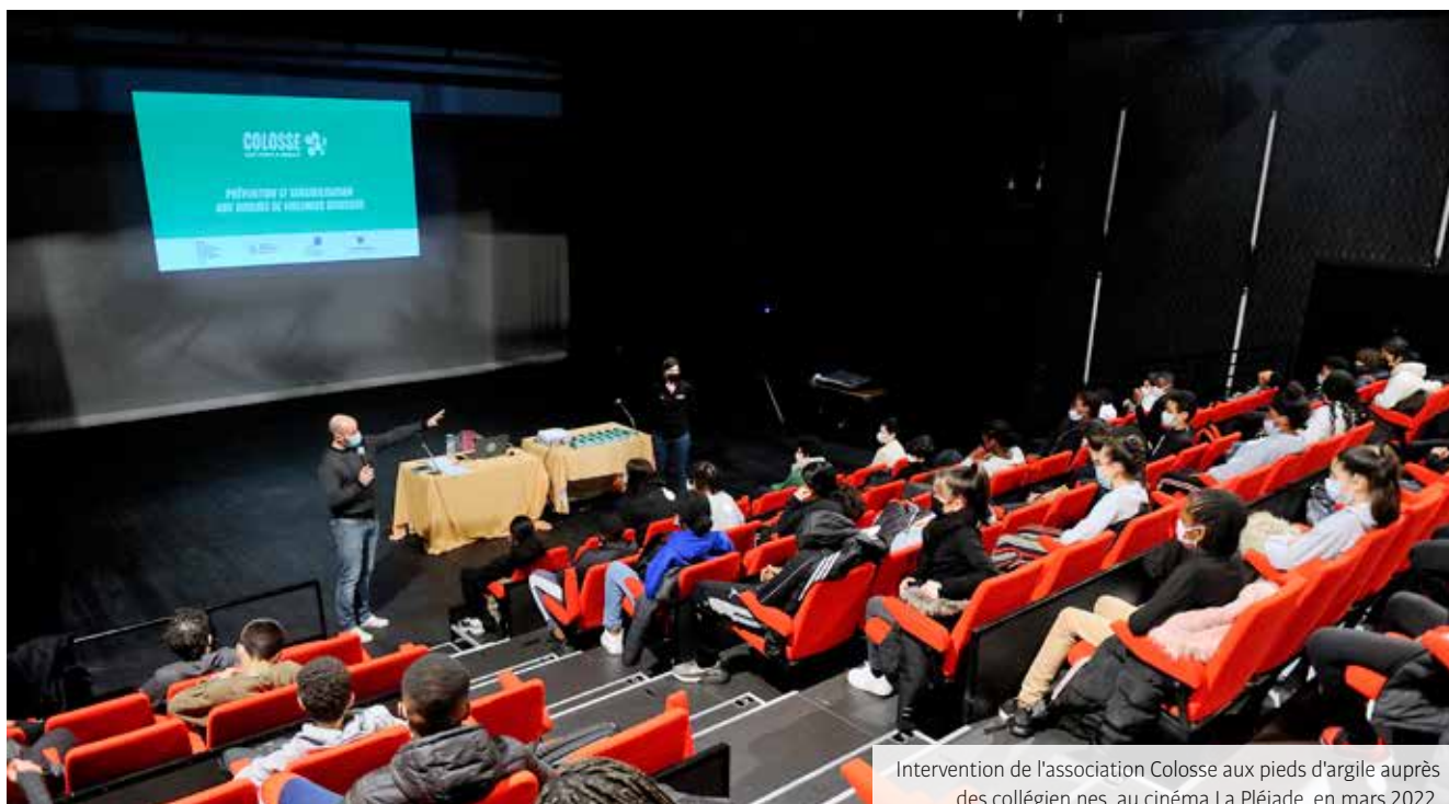
Intervention de l'association Colosse aux pieds d'argile auprès des collégien-nes, au cinéma La Pléiade, en mars 2022.