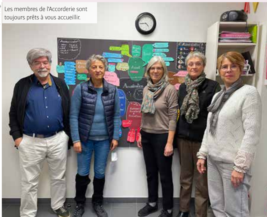
Les membres de l'Accorderie sont toujours prêts à vous accueillir.